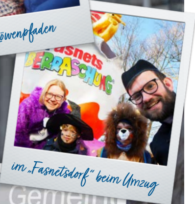
im „Fasnetsdorf“ beim Umzug