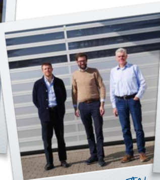
zu Besuch bei ITW