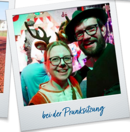
bei der Prunksitzung