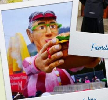
beim Fasnetsumzug dabei