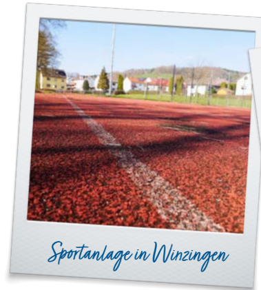
Sportanlage in Winzingen