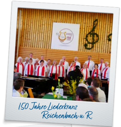
150 Jahre Liederkränz Reichenbach u. R.

„Der gesellschaftliche Beitrag, der vom Ehrenamt geleistet wird, ist von unschätzbarem Wert. Ich werde deshalb das Engagement der Vereine und Gruppierungen aktiv unterstützen.“