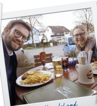
Einzelhandel und Gastronomie unterstützen