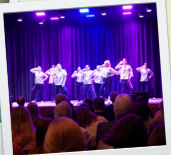
Donzdorfer Schulen präsentieren sich