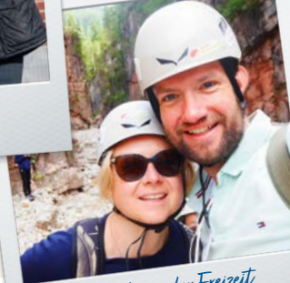
aktiv in der Freizeit