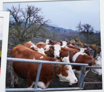
auf dem Dangelhof