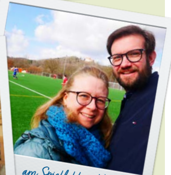
am Spielfeldrand beim 1. FC Donzdorf