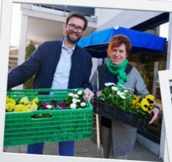
Einkaufen in Winzingen