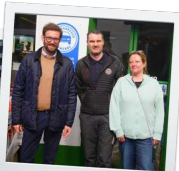
in Grünbach bei Mähleisen's