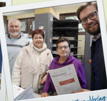
Blättle vom Messelstein-Verlag