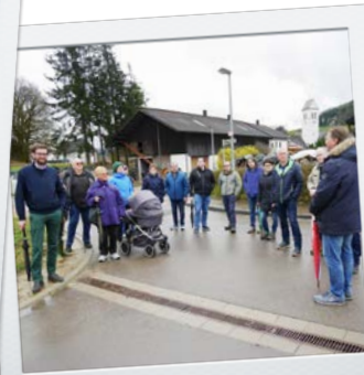
und in Reichenbach u. R.