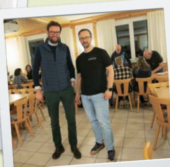
Stammtisch des Dorfvvereins Reichenbach u. R.