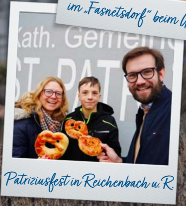
Patriziusfest in Reichenbach u. R.