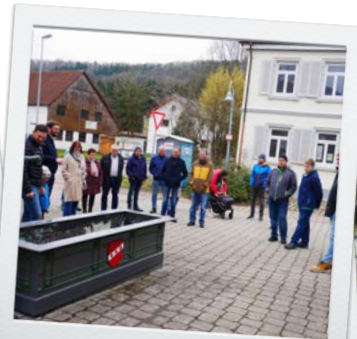
Unterwegs in Winzingen