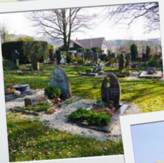
Zukunft der Friedhöfe