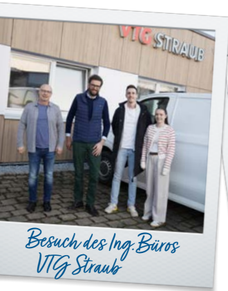
Besuch des Ing. Büros VTG Straub