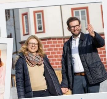
in der Partnerschaft