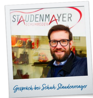
Gespräch bei Schuh Staudenmayer