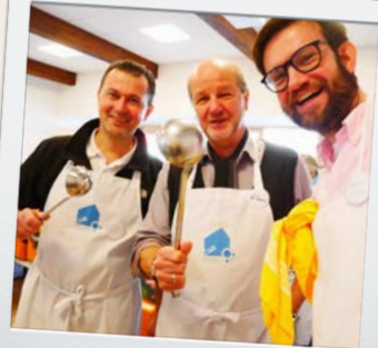
bei der Vesperkirche