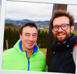
mit dem SAV unterwegs