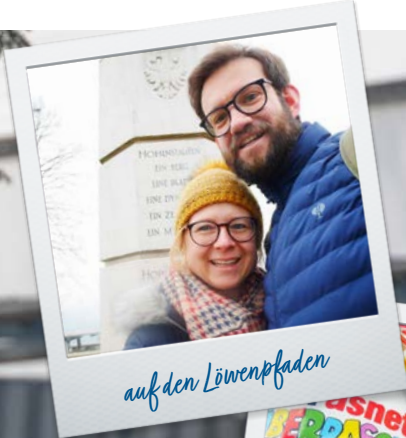
auf den Löwenpfaden